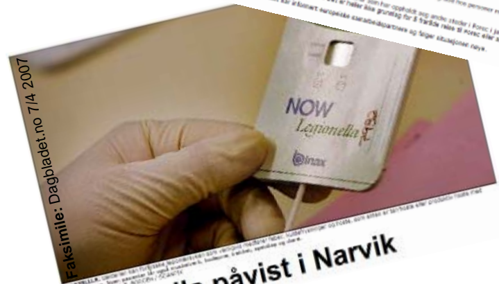
Faksimile: Dagbladet.no 7/4 2007