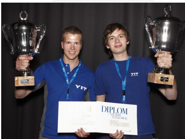
Glade vinnere i elektrofagene.