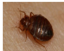
Voksent veggedyr som suger blod og reaksjoner på bitt.

I de fleste tilfeller kommer veggedyr til et overnattingssted via gjester. Dyrene kryper gjerne inn i kofferter, bager eller sekker, og følger med fra ett overnattingssted til det neste. Jo flere gjester et overnattingssted har, desto større er sjansen for å få veggedyr. Veggedyr kan også spre seg ved å vandre mellom rom.